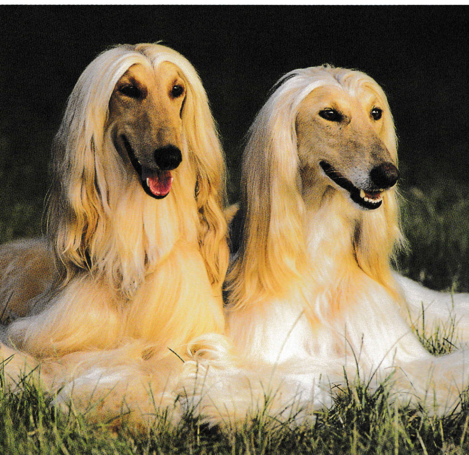
▲ Ogar afgan

Părul stufoș îl apără de intemperii și de atacurile șacalilor.